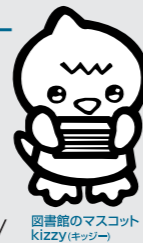
図書館のマスコット Kizzy(キッピー)

問い合わせ/図書館 (☎580・1888)へ。 図書館ホームページ パソコンから https://www.lib.yorii.saitama.jp/ 携帯電話から http://mobile.lib.yorii.saitama.jp/