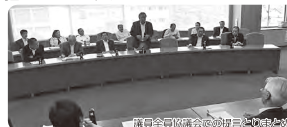
議員全員協議会での提言とりまとめ

議会は皆さんとともに、このサイクルで町の事業をチェックし、次年度予算への反映を目指していきます!