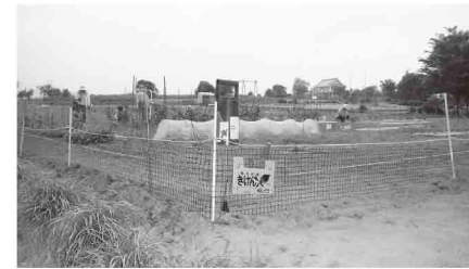
ふれあい講座のほ場に設置した電気柵とネット

効果的な設置方法 地上約30cmに通電線を設置し、その下にプラスチックネットを張り巡らせることで、より効果的にイノシシやアライグマ、ハクビシンなどの侵入を防ぐことができます。農作業用の出入口を設置することも可能です。農業委員会では昨年、この方法で農業ふれあい講座のほ場(大字用土地内)に設置したところ「動物の被害を防ぐことができた」と好評でした。今年も受講生の皆さんと一緒に設置し「初めてでも簡単に設置することができました」との感想をいただきました。