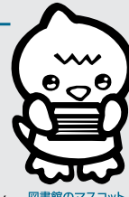
図書館のマスコット Kizzy(キジィ)

問い合わせ/図書館 (☎580・1888) 図書館ホームページ パソコンから https://www.lib.yorii.saitama.jp/ 携帯電話から http://mobile.lib.yorii.saitama.jp/