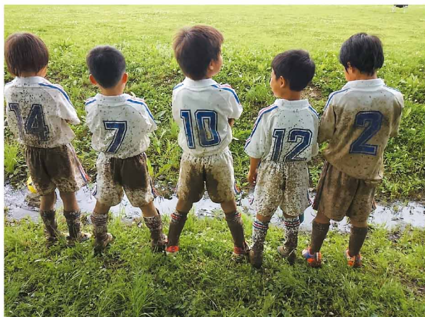
1位 絶対に負けられない戦いがそこにはある