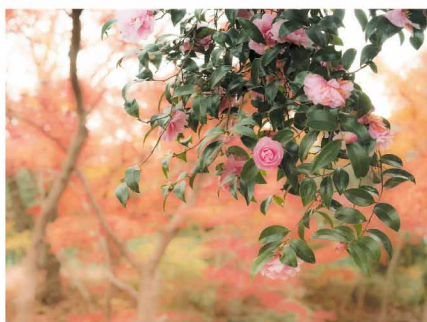
4位 紅葉に映えるサザンカ