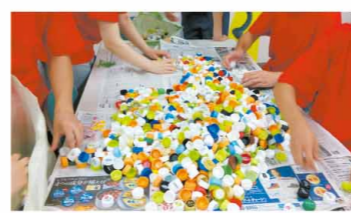
「小さなキャップでも分ければ資源！地球に愛を！プロジェクト」

運営委員会で実施しているこの活動も今年で7年目。皆さんのご協力により、合計9万3000個のキャップが集まりました。ご提供いただいたエコキャップは、再生プラスチック原料として換金し、医療支援・ワクチン支援や障がい者支援、子どもたちへの環境教育等、さまざまな社会貢献活動に充てられます。