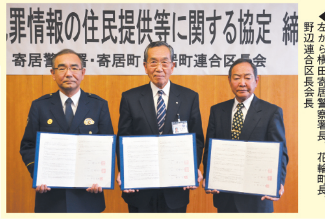
犯罪情報の住民提供等に関する協定 締結 寄居警察署・寄居町連合区長会

今後も、本協定に基づき、積極的に犯罪情報を提供し、町民生活の安全・安心の更なる向上に努めていきます。