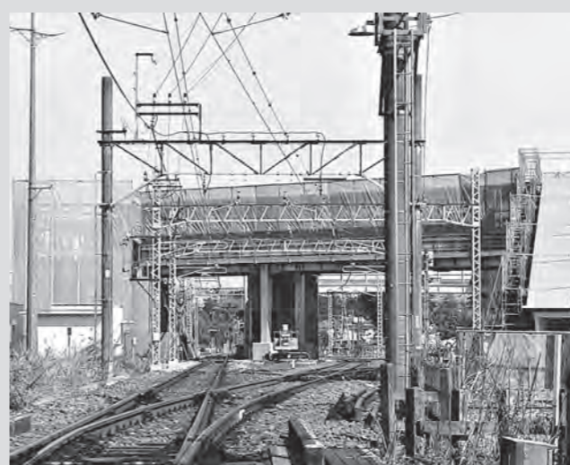
年内の供用開始に向けて整備が進む男衾駅自由通路