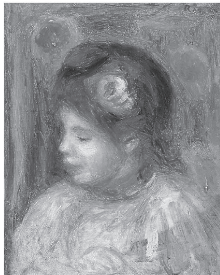
オーギュスト・ルノワール 少女像