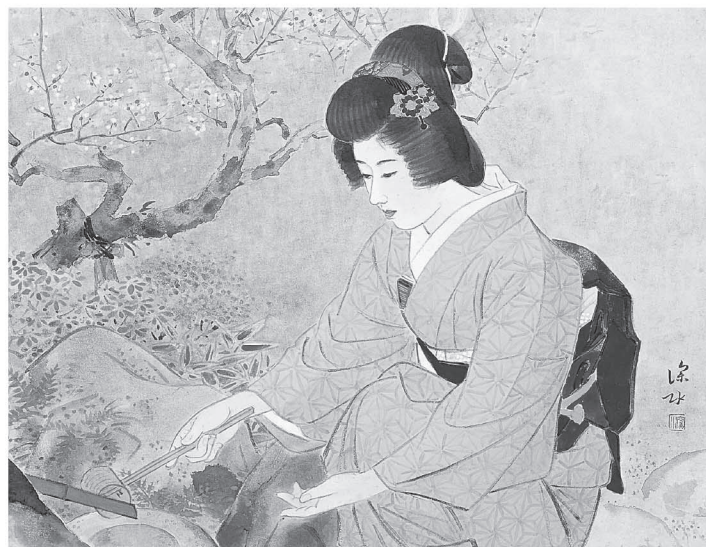
伊東 深水 早春