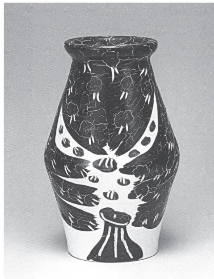
パブロ・ピカソ 花瓶