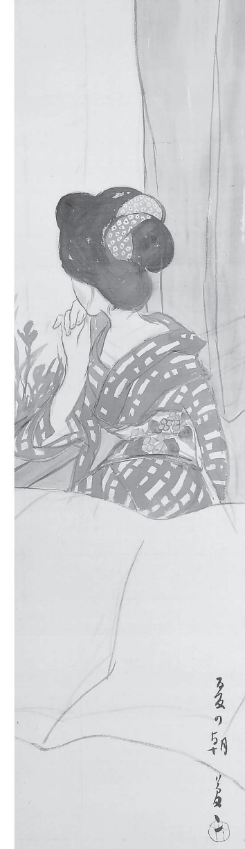
竹久 夢二 夏の朝

町では、12月12日(土)・13日(日)に、地域の芸術・文化の振興を目的に、ピカソやルノワール、岡本太郎など、有名芸術家の作品約120点を展示する「出張美術館in寄居」を総合体育館・アタゴ記念館で開催します。今回展示される作品群は、神奈川県「人間国宝美術館」と「真鶴アートミュージアム」に所蔵されている国内外の有名芸術家や、人間国宝の作品から厳選されたものばかりです。 本物の芸術作品に接することができることのできるこの機会に、是非お出かけください。