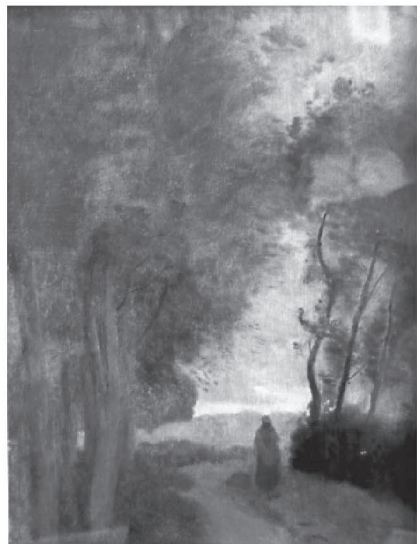
カミーユ・コロー 森の小径