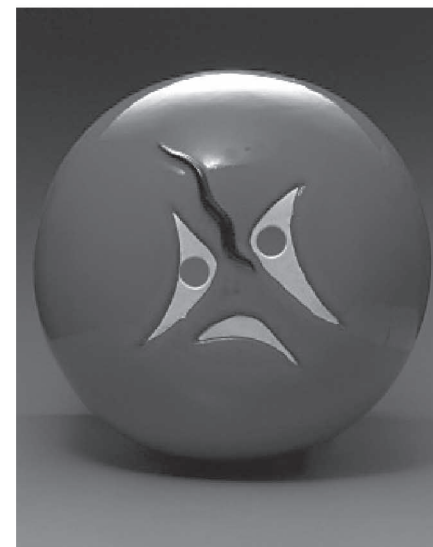
岡本 太郎 坐ることを拒否する椅子