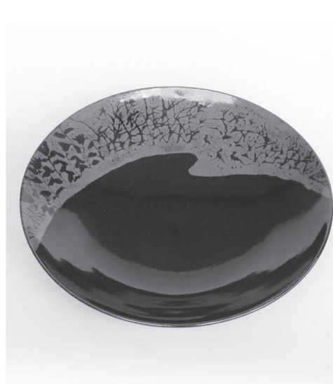
原 清 鉄釉草文大鉢