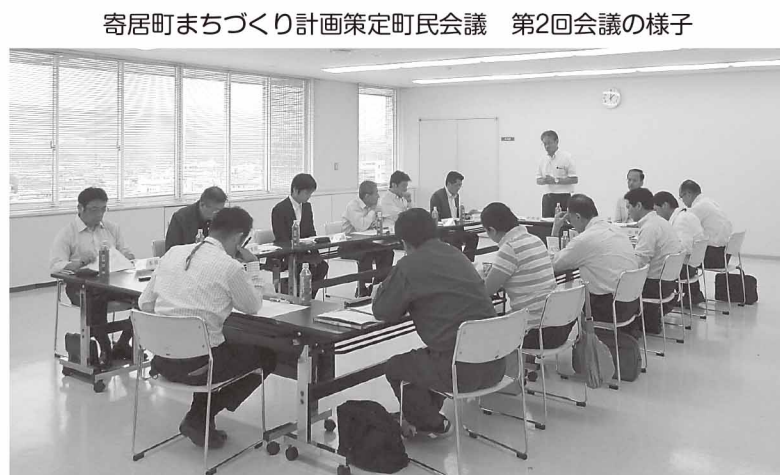
寄居町まちづくり計画策定町民会議 第2回会議の様子

町総合戦略の素案策定にあたり、町の職員で組織した「寄居町まちづくり計画策定プロジェクト・チーム」に加えて、今年7月に町民の皆さんと地域の公共的団体の職員等で組織した「寄