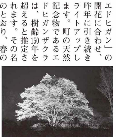
エドヒガンの開花に合わせ、昨年に引き続きライトアップします。