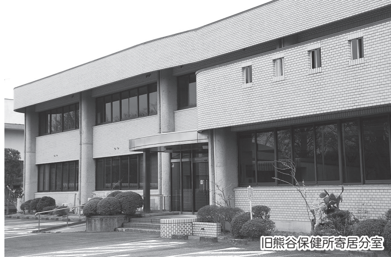
旧熊谷保健所寄居分室