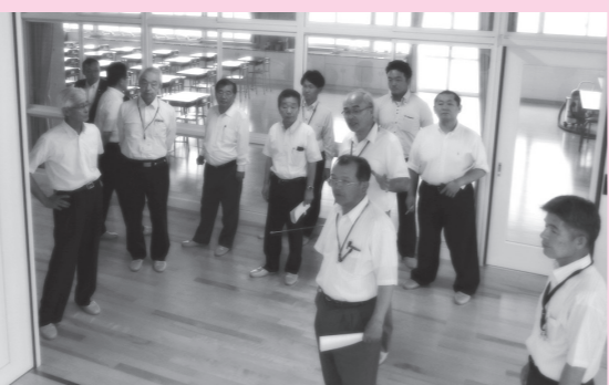
美里中学校の視察

7月7日に開催、町内小中学校施設の現状、国の補助制度など担当課の説明を受けました。