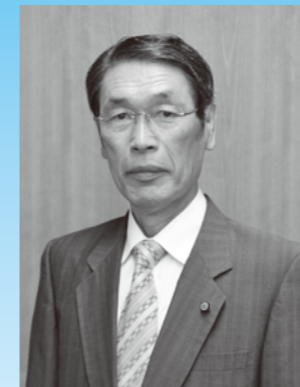
石田茂教育長 勇退

問い合わせ／臨時福祉給付金：健康福祉課臨時福祉給付金担当 (☎581・2121内線126・127)、子育て世帯臨時特例給付金：子育て支援課 (☎581・2121内線252) へ。