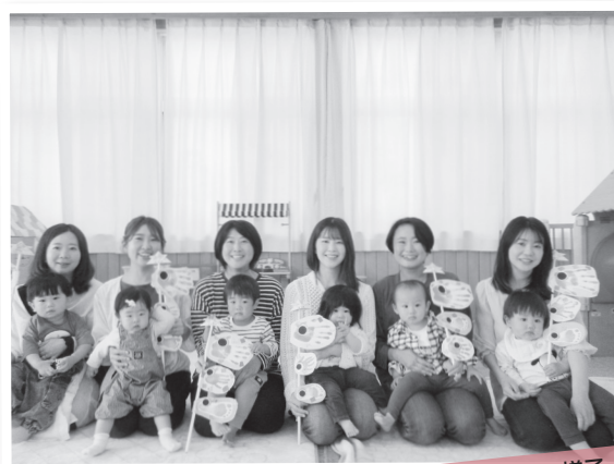
サークル活動の様子

子育て支援センターとは、子育て家庭の親子を対象に、親子同士が交流でき、お子さんと遊べる施設です。寄居町立の子育て支援センターは、寄居保育所、男衾保育所内に併設され、保育士に子育ての相談をしたり、楽しいイベントに参加したりすることができます。