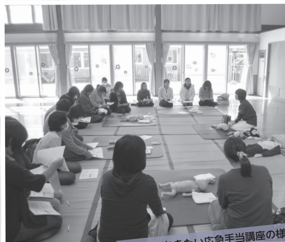
知っておきたい応急手当講座の様子

子育て支援センターとは、子育て家庭の親子を対象に、親子同士が交流でき、お子さんと遊べる施設です。寄居町立の子育て支援センターは、寄居保育所、男衾保育所内に併設され、保育士に子育ての相談をしたり、楽しいイベントに参加したりすることができます。