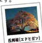
氏邦桜(エドヒガン)