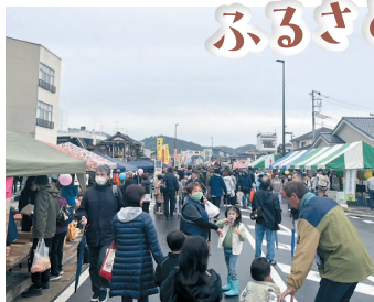
たくさんの出店ブースが並びました。