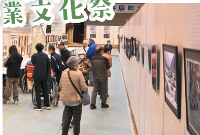
8日と9日に行われた総合体育館・アタゴ記念館の屋内展示の様子です。