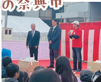
メインステージも盛り上がりしました。