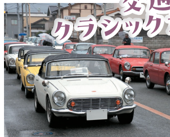
往年の名車が並びます。