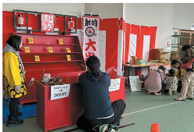
寄居町合併70周年特設会場では縁日がにぎわいをみせました。