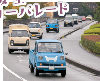
約20分間、ゴールに向かってクラシックカーが町を走り抜けました。