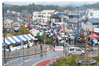
9日、産業文化祭(屋外会場)は、たくさんの出店ブースが並び大盛況でした。