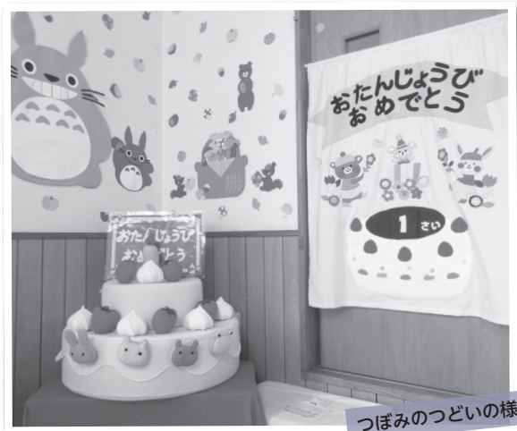
つぼみのつどいの様子

子育て支援センターとは、子育て家庭の親子を対象に、親子同士が交流でき、お子さんと遊べる施設です。寄居町立の子育て支援センターは、寄居保育所、男衾保育所内に併設され、保育士に子育ての相談をしたり、楽しいイベントに参加したりすることができます。