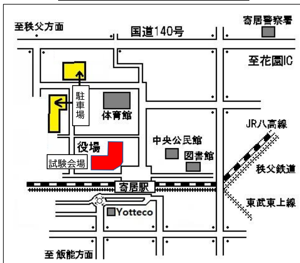
試験会場(寄居町役場)及び駐車場案内図