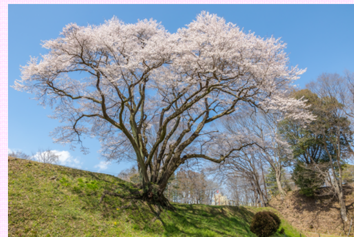
町の天然記念物である「鉢形城の桜・エドヒガン」 (愛称：氏邦桜)