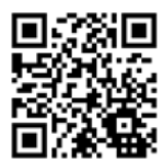
町公式ホームページ (トップページ)