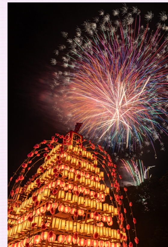
「関東一の水祭り」と呼ばれる寄居玉淀水天宮祭