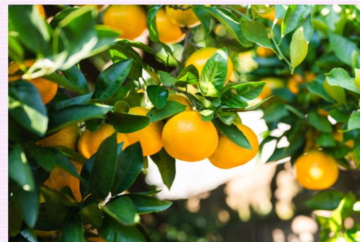
みかん狩りのシーズンには多くの方が訪れる 「風布みかん山・小林みかん山」