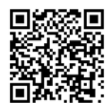
企業版ふるさと納税 (内閣府地方創生推進事務局)