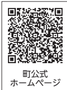
町公式ホームページ