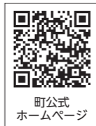
町公式ホームページ