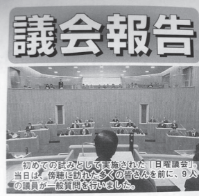
平成12年12月議会では、「日曜議会」として一般質問を実施(広報よりのえの記事から転載)

差が出ていることから協議したもので、所管事項を他町村の委員会構成と比較し、さまざまな組み合わせを検討しました。 また、総務経済常任委員会での道路の認定・廃止に伴う現地視察の必要性や、2委員会に再編された経過なども話し合い、検討委員会では、「再編することを前提に引き続き検討を続けること」「再編の時期等については、次の委員会で対応を検討していくこと」としました。