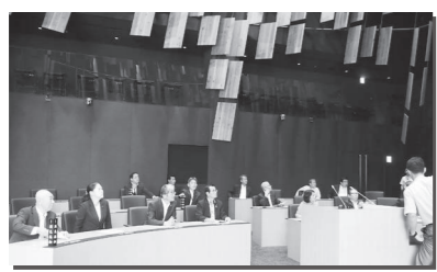
長岡市の議場。円形に配置された座席、花火をイメージしたパネル

湯沢町では、地震等の災害により町の災害対策本部が設置されたとき、議会も災害対策本部を設置し、町本部が行う事業に積極的に協力して、住民の生命・財産の保全に努めることなどを、