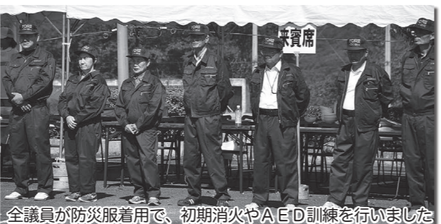
全議員が防災服着用で、初期消火やAED訓練を行いました

3回目となった総合防災訓練は、「震度7の地震が発生、多くの被害が出て、町の災害対策本部が設置された」という想定で始まりました。町議会も災害対策支援本部の設置訓練のほか、各議員が水消火器や濡れシートを使った初期消火訓練やAED訓練、傷病者搬送訓練に参加しました。 災害対策支援本部や災害発生時の議員の対応・行動については、前号の議会だよりで紹介しましたが、改めて訓練してわかることもあります。