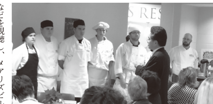
▲メアリズビル高校の生徒に謝辞を送る町長

12月3日には、教育の現場を視察するため、市の郊外にあるナビン小学校へ行きました。ナビン小学校は、日本の小学1年から4年生に当たる児童約380人が通う小学校です。メアリズビル市の公立学校は州が区分する学区のうちの一つ、メアリズビル学区に属しています。メアリズビル学区には、小学校5校(1〜4年)、初等学校(5〜6年)1校、中学校(7〜8年)1校、高校(9〜12年)1校があり、全体で約5千人の児童・生徒が通っています。視察では、学校で制作した歓迎のDVDや児童の楽器の演奏