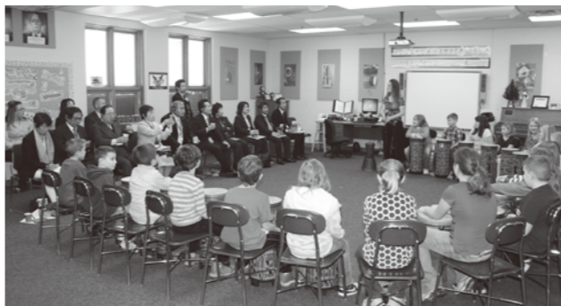
▲ナビン小学校の児童から歓迎を受ける視察団

12月3日には、教育の現場を視察するため、市の郊外にあるナビン小学校へ行きました。ナビン小学校は、日本の小学1年から4年生に当たる児童約380人が通う小学校です。メアリズビル市の公立学校は州が区分する学区のうちの一つ、メアリズビル学区に属しています。メアリズビル学区には、小学校5校(1〜4年)、初等学校(5〜6年)1校、中学校(7〜8年)1校、高校(9〜12年)1校があり、全体で約5千人の児童・生徒が通っています。視察では、学校で制作した歓迎のDVDや児童の楽器の演奏