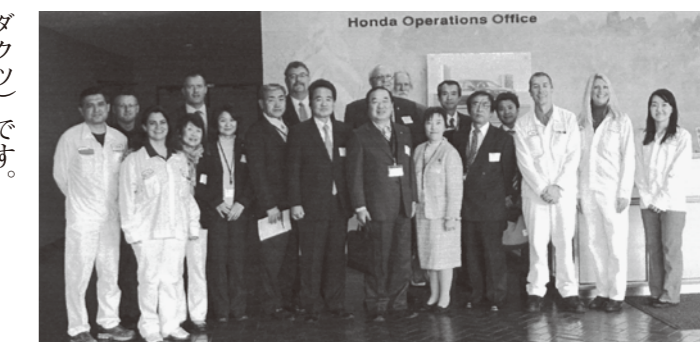
▲ホンダ・オブ・アメリカのメアリズビル工場を視察

12月2日と3日に、メアリズビル市がオハイオ州で近年発展している要因ともなっている企業の状況を視察しました。視察先は、ホンダの現地法人として市とも関係の深いホンダ・オブ・アメリカのメアリズビル工場、自動車のキーロックなど周辺部品を開発するホンダ・ロック社、自動車部品加工用のロボットを製作しているオート・ツール社、コーヒーや菓子などの世界的なメーカーであるネスレ社の研究開発センター、メアリズビル市の主要な農産物である大豆を日本に輸出している株式会社兼松(KG・アグリプロ