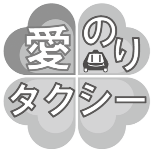
「愛のりタクシー」の車両には、このマークが表示されています。

問い合わせ/制度の概要や利用登録は企画課(☎581・2121内線361)、予約は予約センター(社会福祉協議会内、☎580・0555)へ。