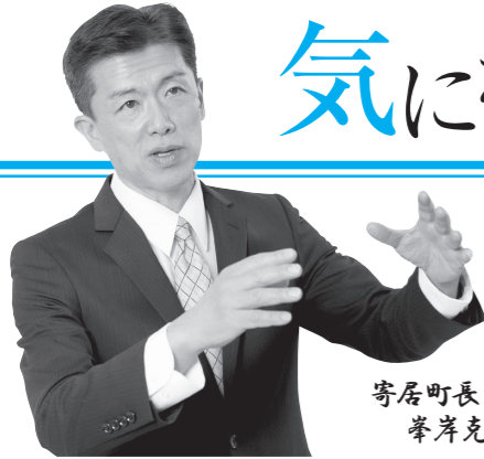
寄居町長 峯岸 克明