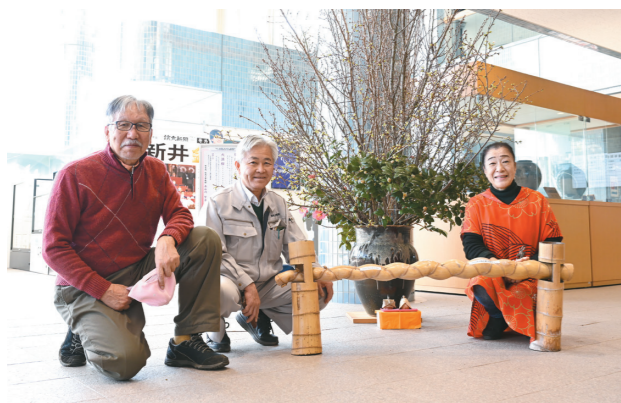
桜を飾り付けていただいた桜の会の皆さん

草刈り、定例会では桜に関する情報交換を行っています。 このような活動のほかにも、平成24年度に町内の桜の名所を掲載した「桜マップ」を作成。平成27年度には、中央公民館ホール(現寄居町民ホール)で、映画「陽光桜」の上映会を主催す