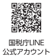
国税庁LINE公式アカウント

期間/2月16日(木)~3月15日(水) ※土・日曜日、祝日を除く。2月19日(日)、26日(日)は開場 ※贈与税については、2月1日から申告相談を受け付けています。 相談受付 午前8時30分~午後4時 相談開始 午前9時~ ※なお、午後4時前であっても、相談受付を終了する場合があります。 場所/熊谷税務署(熊谷市仲町41) ご協力をお願いします ○確定申告会場に来場される際は、マスクを着用していただき、少人数でお越しください。 ○入場の際に検温を実施しています。せき・発熱等の症状がある方は入場をお断りさせていただきます。 ○マイナンバーカードをお持ちでない方は、お早めの取得をお願いします。 熊谷税務署 ☎521・2905