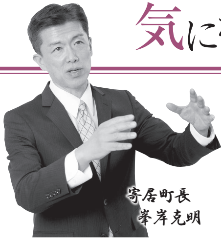
寄居町長 峰岸 克明