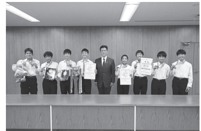
埼玉県No.1チームの選手とともに!!

持っていること。そして、リザーブの選手も含めてとても意識が高いこと。 優れた指導者とご家族や関係者のサポートに恵まれ、競技者としてだけでなく、人間力も高いと感じました。12月4日の関東大会、そして12月18日の全国大会でも活躍を期待いたします。将来は日本を代表するランナー、オリンピック選手に成長してほしいと思います。 女子チームも頑張ってくれました。1、2年生5人で臨みましたが63チーム中11位と大健闘!! すべてのメンバーが残る来年はさらに楽しみです。 コロナ禍で明るいニュースが少ない中、寄居町の誇れる快拳となりました。 おめでとう! 男衾中駅伝チーム。