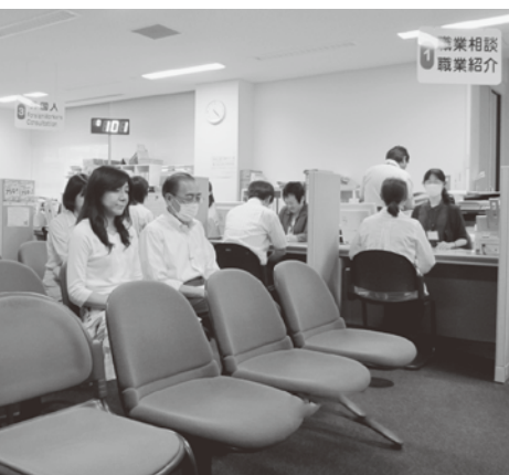
待合室では、求人情報の閲覧ができます。

さまざまな研修を企画しています。若年者（39歳以下の方）を対象とした合同面接会および女性が働き始めるためのセミナー等を予定しています。 内職相談 町内に事業所を構える企業の内職情報を提供します。 県内外で行われるセミナーのお知らせもあります。順番待ちの間にご覧ください。