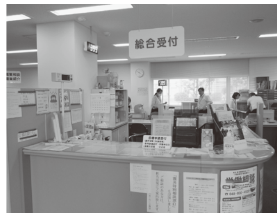
ご利用の際は、総合受付にお立ち寄りください。

事業所の求人申込書の取り次ぎができませんので、ハローワーク熊谷まで出向く必要はありません。