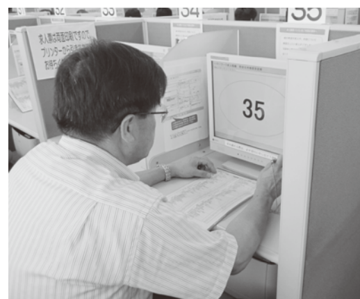
簡単な操作で、気軽に利用できます。

登録件数は約76万件！最新の求人情報を簡単に検索！タッチパネル式の求人検索機から、全国のハローワークに登録されている約76万件の最新求人情報を簡単に検索・閲覧し、求人情報の印刷ができます。