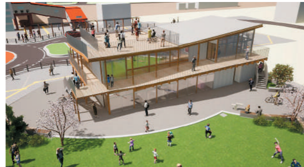
▼広場「YORIBA」完成イメージ