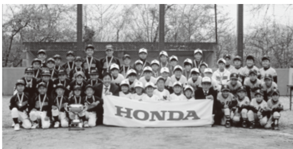
本田技研工業株式会社より、町のスポーツ振興、青少年健全育成のため、寄居町スポーツ少年団野球部会に、優勝カップとメダルが寄贈され、4月21日に寄居運動公園で「第1回ホンダカップ寄居町少年野球大会」が開催されました。