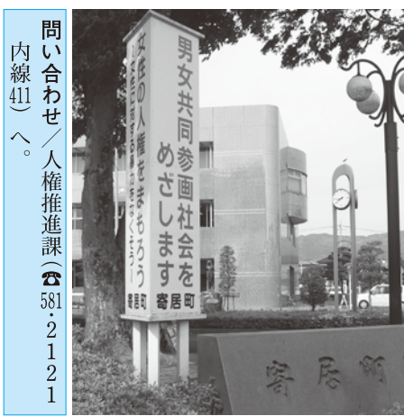
問い合わせ/人権推進課(☎581・2121 内線41)へ。

会の実現に向けて皆さんへご紹介します。ぜひ、お越しください。 町では、役場庁舎前に「男女共同参画推進プラン2010」の基本理念等を表示した啓発塔を設置しています。