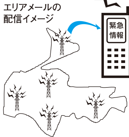
エリアメールの配信イメージ

迷惑メール防止機能や受信制限の設定を行っている場合は「yorii-mail@town.saitama.jp」からのメールが受信できるように設定してください。登録手順は、町公式ホームページでもご案内していますので、ご利用ください。