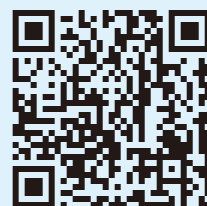
スマートフォン用