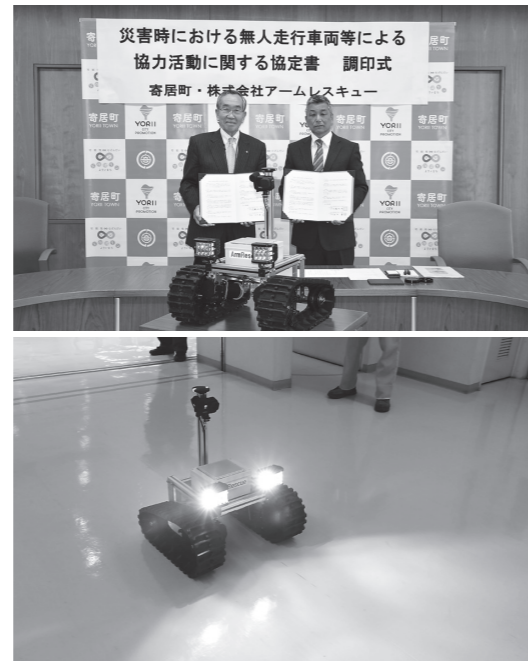
自治防災課(☎581・2121内線371)

また、協定締結に当たり、町に「無人偵察車両(レスキューアイ)」をご寄附いただいたことで、災害発生時、町がレスキューアイを使用し、進入困難な現場での情報収集が行えるようになりました。地元企業である同社との協定により、災害発生時の救助・救援活動を迅速に行い、地域力を生かした災害に強いまちづくりを進めます。