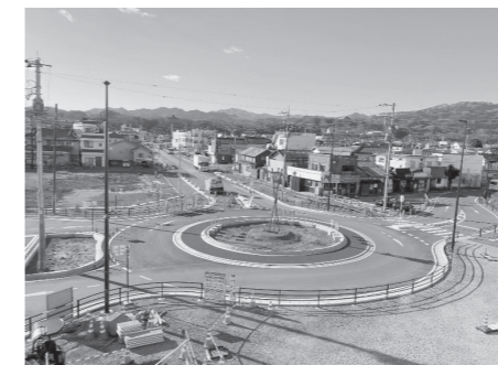
都市計画課(☎581・2121内線243)

寄居都市計画道路中央通り線は、寄居駅南口周辺における中心市街地活性化事業の一環として整備を進めていますが、車道部については、7月4日午後3時からの開通後、現在の一方通行規制を解除し、2車線(対面通行)での供用を開始します。引き続き、歩道部の舗装や植栽などの整備を行い、令和4年度末にすべての工事が完了する予定です。