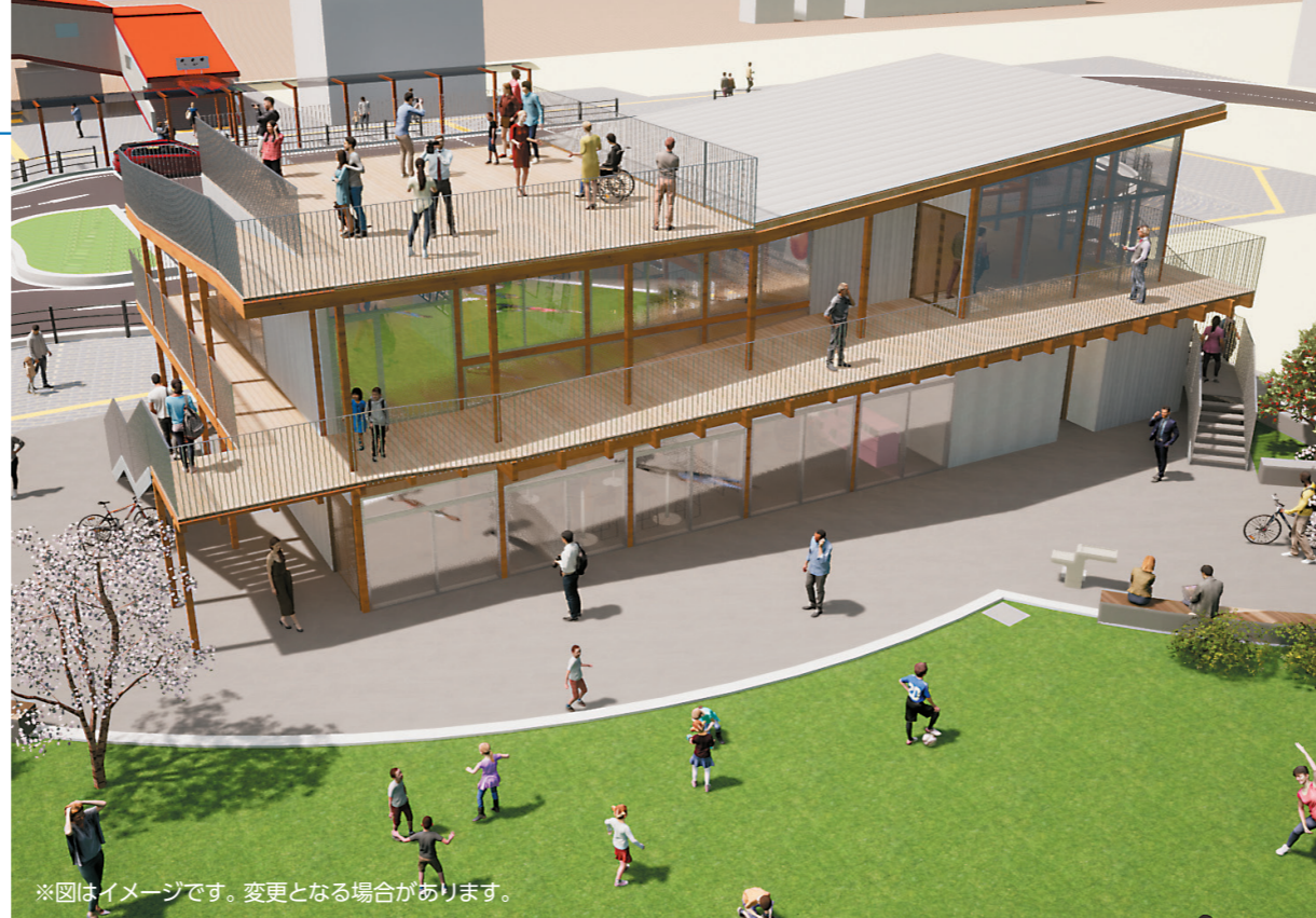
※図はイメージです。変更となる場合があります。

駅前拠点施設の南側に、中庭のように広がり、施設と一体となる約1,000㎡の広場。拠点施設からシアター状に緩やかな勾配のある芝生の脇には、寄居の山々に自生する木々と、間接照明入りの階段形状のベンチを設け、使う方のスタイルでくつろぐことができます。防災井戸やマンホールトイレなど防災施設も備え、賑わいの創出とともに、地域の安心拠点としての機能を備えます。また、町の魅力を体験できるソフト事業の実施や、マルシェの開催、キッチンカーを使ったイベントの実施等を想定しており、より多くの来訪者呼び込み、日常的な賑わいを創出する広場を目指します。