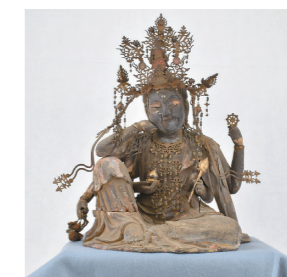
木造如意輪観音坐像

本展では、県立歴史と民俗の博物館が保管していた昌国寺の資料を地元に戻りさせ、また、同寺に残る什物を合わせて展示公開します。