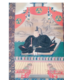
東照権現(徳川家康)像