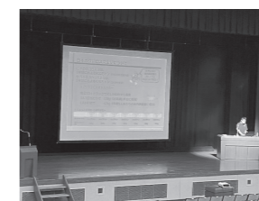
もったいない話 (食品ロスについて)