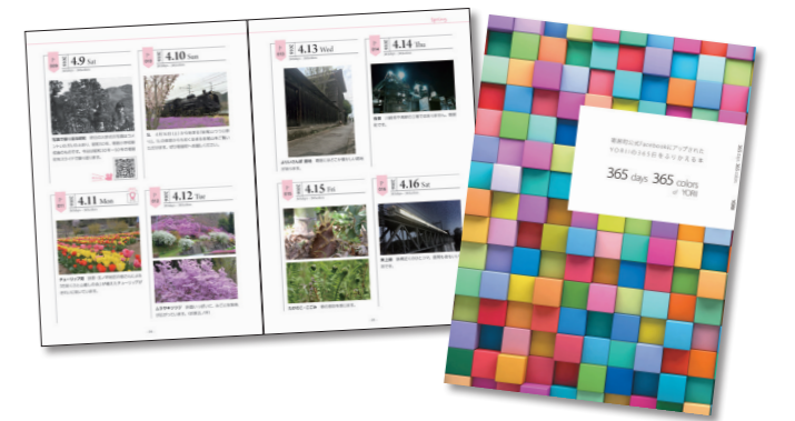
▲365 days 365 colors of YORII 町公式フェイスブックが伝えた町の365日を一冊にまとめました。

情報発信の方法はホームページ、そしてSNSへ 時代に合わせ、町の情報発信の方法は大きく変わりました。これまでの広報よりの発行に加え、平成13年には、町公式ホームページを開設しました。 また、平成26年にはフェイスブックを開設、行政情報や災害情報のほか、町の移り変わる日常風景などをお届けしています。平成29年には、町公式フェイスブックで紹介した1年間をまとめた「365 days 365 colors of YORII」