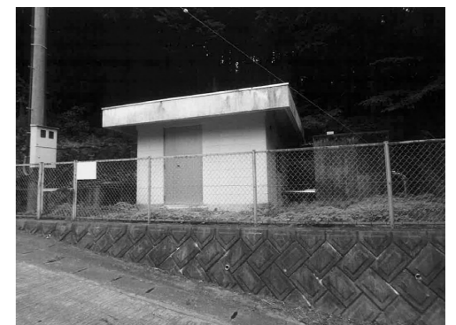
増圧施設(中継施設)

浄水場や配水場には、付帯する施設や設備があります。管理棟などの建築物や配水池などのコンクリート構造物といった大きな物から、電気・機械設備などの小さな物まで、大小合わせると600点以上になります。数が多い理由としては、水源が河川水であるため浄水処理工程が多いことや、町の地形が起伏に富んでいるため水道水の送水・配水に中継施設などが必要になることが挙げられます。