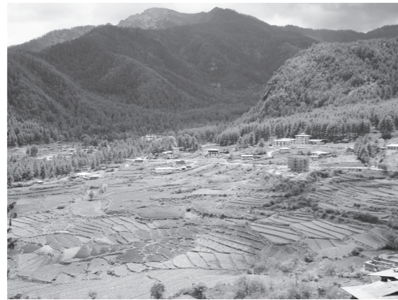
☎ 総合政策課 (☎ 581・2121内線462)

町では、ブータン王国オリンピック委員会との協定に基づき、東京2020オリンピックにおけるブータン王国陸上チームの事前キャンプ受け入れ準備を進めてきましたが、ブータン王国陸上選手がオリンピックの出場資格を得ることができなかったため、事前キャンプは中止となりました。