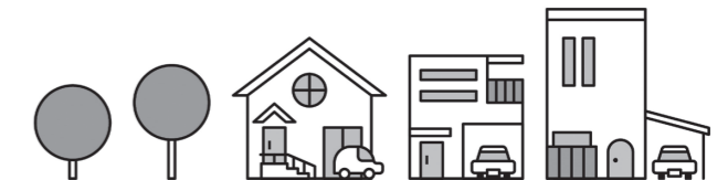
☎ 県建築安全課 (☎ 048・830・5527)