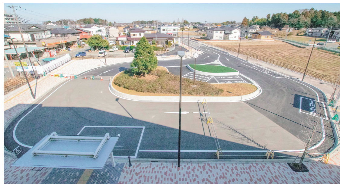
男衾駅東口(2月中旬撮影)