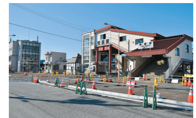
寄居駅南口(2月中旬撮影)

今後も、関係する多くの方のご協力をいただきながら、町民の皆さんと共に“笑顔あふれる、誇れるまち”となるよう、積極的な事業を展開していきます。