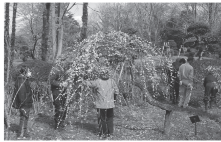
(社)寄居町シルバー人材センター(☎581・3451)へ。

募集 令和3年度4月入校生追加募集! 県立熊谷高等技術専門学校 ①建築科、②電気設備管理科 ③介護サービス科 対 ①おおむね30歳までの方、②③年齢不問 内 ①筆記試験(国語と数学)および面接試験、③面接試験 願書受付/①②2月22日(月)まで、③2月18日(木)〜3月8日(月) 選考日 ①②2月26日(金)、③3月11日(木) ※②③は秩父分校の募集です。 入校相談会 日 2月12日(金)午前10時〜午後4時 場 県立熊谷高等技術専門学校(熊谷市新堀新田522) 対 入校を検討されている方 内 個別相談、授業見学のほか、同校の概要を詳しく説明します。 申 実施前日までに同校へ。 共通 問 県立熊谷高等技術専門学校 ☎532・6559)