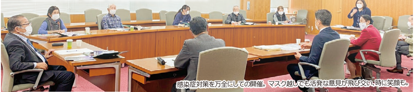
感染症対策を万全にしての開催。マスク越しでも活発な意見が飛び交い、時に笑顔も。

昨年11月6日、コロナ禍で延期となっていた議会報告会・意見交換会を開催。今年度スタートした「議会モニター」から、変わりつつある町について多くの意見をいただきました。議会も「聴く→動く」の具現化に挑戦していきます。