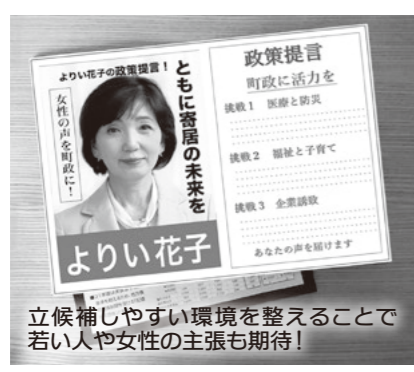
立候補しやすい環境を整えることで若い人や女性の主張も期待!

公職選挙法の改正により、町村の議会の議員選挙にも「供託金制度(*)」(15万円)が導入され、政策ビラの頒布も解禁。さらに首長や議員の選挙費用の一部を公費負担とする条例案を可決。なり手不足の打開が期待されます。