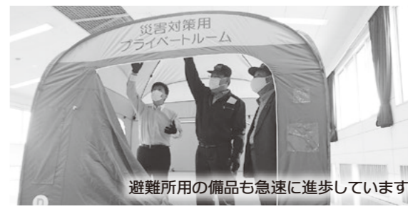
避難所用の備品も急速に進歩しています

令和元年の台風第19号で開設した避難所での教訓や感染症予防の観点から、町では、資機材や備蓄品の追加購入をしてみました。新しく整備された避難所開設BOX(懐中電灯マスク、消毒液・文具等、40種類以上入った持ち運びできる箱)の内容や、避難所用テント、段ボールベッド等を実際に組み立てる訓練をし、所要時間や難易度等を確認しました。