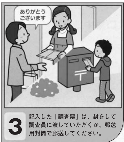
3 記入した「調査票」は、封をして調査員に渡していただくか、郵送用封筒で郵送してください。