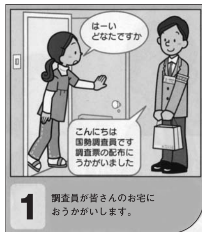
1 調査員が皆さんのお宅におうかがいします。