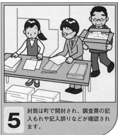
5 封筒は町で開封され、調査票の記入もれや記入誤りなどが確認されます。