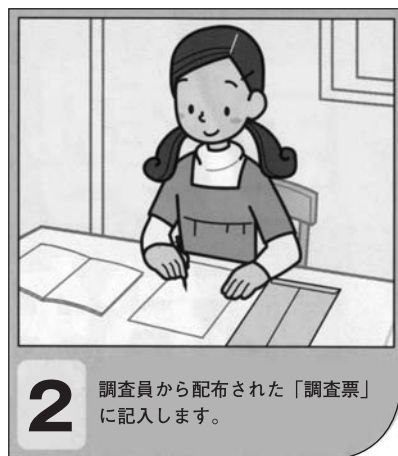
2 調査員から配布された「調査票」に記入します。