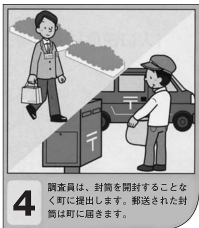
4 調査員は、封筒を開封することなく町に提出します。郵送された封筒は町に届きます。