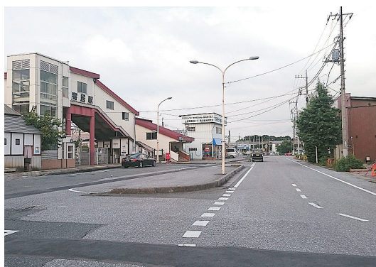
▲現在の寄居駅南口

中心市街地活性化基本計画では「歩きたくなる・歩いてお得なまち」をコンセプトに掲げています。住むことで快適さを、訪れることで楽しさを、歩くことで豊かさを感じることで「お得感のあるまち」を目指しています。