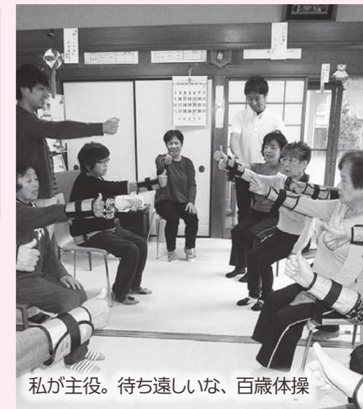
私が主役。待ち遠しいな、百歳体操

[富岡市 (ふれあいパーク岡成)] 官民一体の居場所づくり。市内23か所どこでも自由参加。