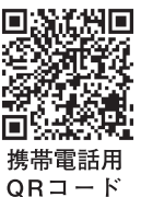
携帯電話用QRコード

優待カードの裏面に、家族や子ども（中学生以下）の氏名、年齢を記載してください。記名されたご本人に限り利用できます。また、他人に譲渡、貸与はしないでください。