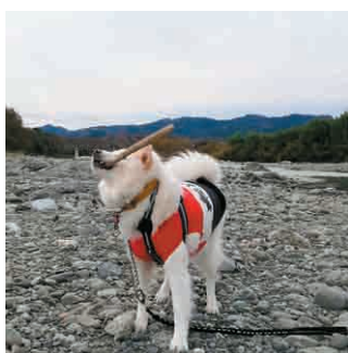
銀賞「剣を振り回すワン」 撮影時期：令和元年12月6日 撮影場所：かわせみ河原