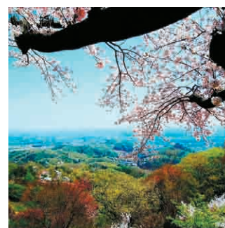
銀賞「鐘撞堂山の春」 撮影時期：平成31年4月 撮影場所：鐘撞堂山