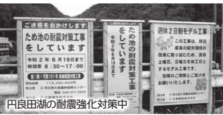
円良田湖の耐震強化対策中