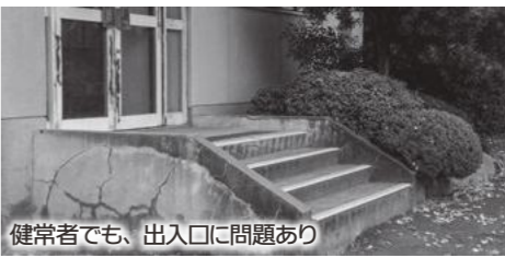
健康者でも、出入口に問題あり