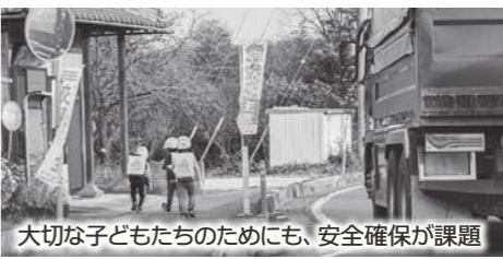
大切な子どもたちのためにも、安全確保が課題