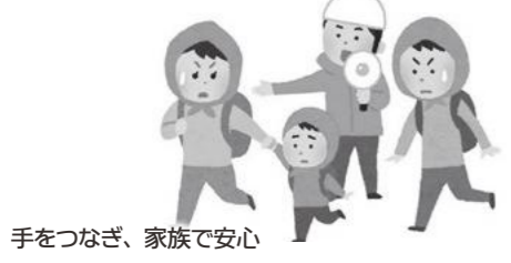
手をつなぎ、家族で安心