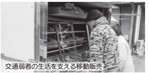
交通弱者の生活を支える移動販売